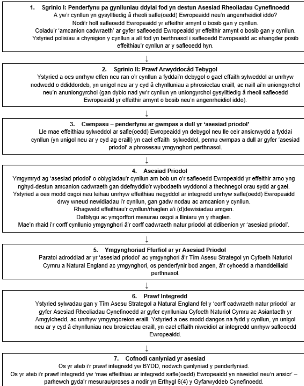
Ffigur 3. Trosolwg o gamau'r broses ar gyfer cynnal Asesiad Rheoliadau Cynefinoedd.