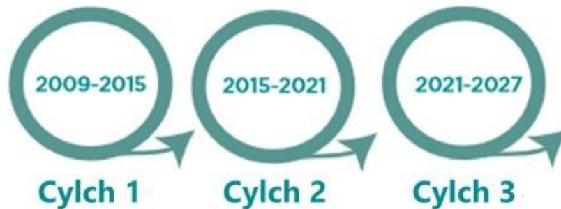
Ffigur 4. Diagram cynllunio sy'n dangos y cyfnodau amser a gwmpesir gan bob cylch rheoli basn afon.

Cafodd cylch cyntaf y Cynlluniau Rheoli Basn Afon eu cyhoeddi yn 2009 a gwnaethant sefydlu'r fframwaith ar gyfer diogelu a gwella'r amgylchedd dŵr o 2009 hyd 2015. Roedd rhai o'r ymrwymadau'n ymestyn hyd 2021 a/neu 2027 a chafodd y rhain eu hadolygu a'u diweddarau yn ystod Cynlluniau Rheoli Basn Afon yr ail gylch, a gyhoeddwyd yn 2015. Mae'r trydydd cylch, unwaith eto, yn adolygu cynnydd yn erbyn yr amcanion a, lle bo angen, yn diwygio'r amcanion a'r rhaglen o fesurau cysylltiedig y disgwylir eu cyflawni rhwng 2021 a 2027 (gweler Ffigur 4 isod).